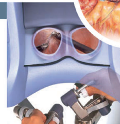
Blick aus der Sicht des Operateurs an der Steuerkonsole