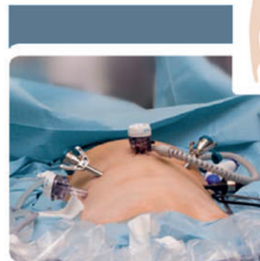
OP-Situation mit „ da Vinci ® Xi HD-System“